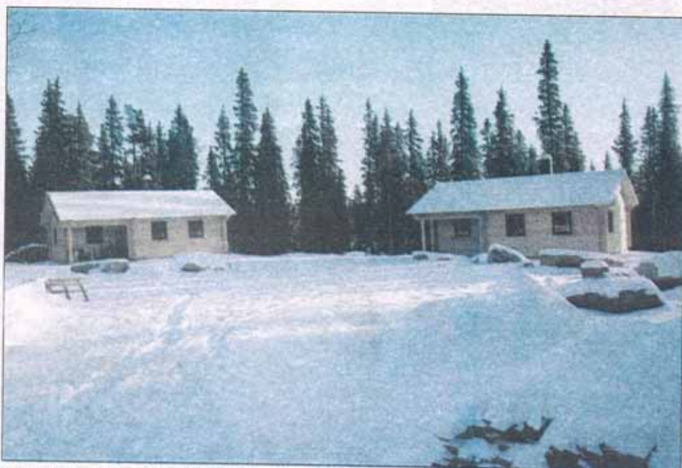
Stugorna ska bli fyra till antalet och inrymma totalt 22 bäddar. Lagom till att snön lade sig på marken var stugorna uppförda. Nu återstår att bygga klart invändigt.

med planerna. Mycket beror på hur vi kan utveckla ett samarbete med andra markägare, säger Christoph Schenk.